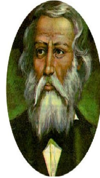
General José Trinidad Cabañas

Este prócer, siendo presidente de la República en 1854 al dirigirse a las dos cámaras del Poder Legislativo y desacreditó la imposición de feudos partidistas y llamó a la hondureñidad a la conciliación. Expresó que la administración de los gobiernos deberían estar libres de nepotismos y de intereses parciales, reconoció en esta ocasión que las facciones que responden a intereses particulares compiten por el poder han impedido darle un gobierno ordenado y de leyes al país. Hizo énfasis en que "hechos nacionales, más bien que personales debían caracterizar a todos los gobiernos", estableciendo así uno de los principios básicos en que se fundamenta la doctrina del Partido Nacional.