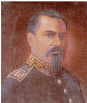
General Luis Bográn

En En esta ocasión se aprobó participar con el nombre de "Movimiento Nacional Progresista". Aquí comienza el primer intento de crear una nueva opción política en Honduras. En este proceso electoral la tendencia liberal nominó como candidato a la presidencia de la República a Policarpo Bonilla y el resultado fue el siguiente: Movimiento Nacional Progresista 34 mil votos y los liberales 15 mil votos. Después del triunfo electoral los opositores, no aceptaron el resultado obligando al general Leiva mantenerse firme en el mandato que le había otorgado el pueblo hondureño y asumió el poder de la nación el 30 de noviembre de 1891. Posteriormente los Progresistas sufren un desgaste interno, sin embargo, el general Ponciano Leiva gobernó por 14 meses en medio de una guerra civil. esta ocasión se aprobó participar con el nombre de "Partido Progresista". Aquí comienza el primer intento de crear una nueva opción política en Honduras. En este proceso electoral los liberales nominaron como candidato a la presidencia de la República a Policarpo Bonilla y el resultado fue el siguiente: Partido Progresista 34 mil votos y los liberales 15 mil votos. Después del triunfo electoral los opositores, no aceptaron el resultado